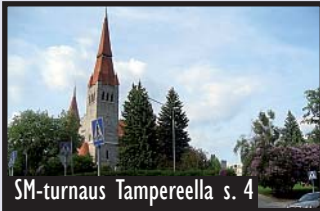
SM-turnaus Tampereella s. 4