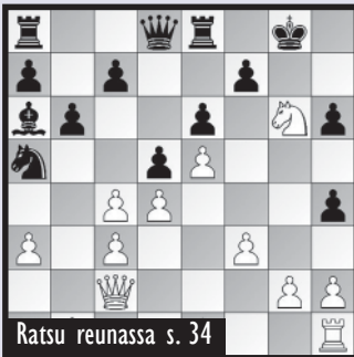
Ratsu reunassa s. 34